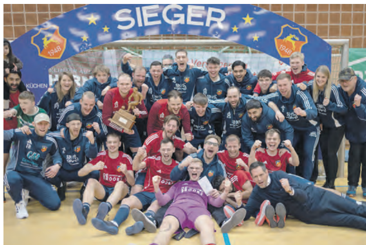
Ministerpräsident Olaf Lies (unten rechts) ließ es nicht nehmen, dem Siegerfoto beizuwohnen

Nach der erfolgreichen Wiedereinführung im Vorjahr fand